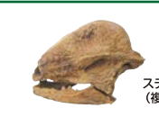
ステゴケラスの頭骨 (複製、岐阜県博物館蔵)

こた 答え A パキケファロサウルスやステゴケラスなどの堅頭竜類は、その分厚く堅い頭を互いに押し付けあって力を競い合っていたと考えられています。