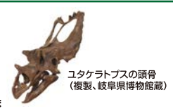
ユタケラトプスの頭骨 (複製、岐阜県博物館蔵)

こた 答え C 後期白亜紀の北アメリカに生息していたユタケラトプスやトリケラトプスは、ケラトプス科に属する大型の角竜類恐竜です。