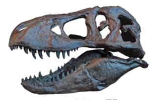
ティラノサウルスの頭骨 (複製、岐阜県博物館蔵)