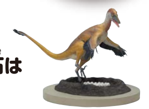
トロオドン類の復元模型 (徳川広和作、岐阜県博物館蔵)

こた 答え B 岐阜県高山市で見つかったトロオドン類の卵の殻 (=卵殻) の化石は、恐竜の卵化石としては日本最古 (約1億3000万年前) の化石です。