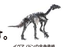
イグアノドンの全身骨格 (複製、岐阜県博物館蔵)

こた 答え B 植物食恐竜であるイグアノドンは、天敵の肉食恐竜から身を守るため、手の親指の骨がスパイク状に尖っていました。